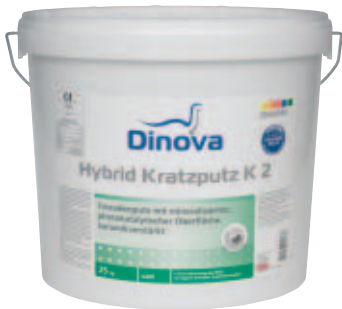
Hybrid Kratzputz K1,5 / K2 / K3