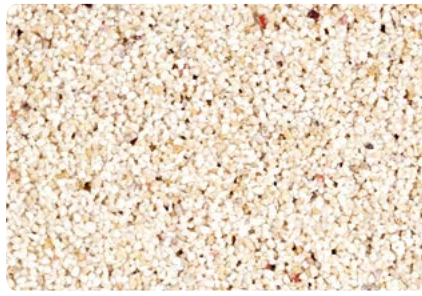
8766 (Farbton der Zwischenbeschichtung: VN2630)