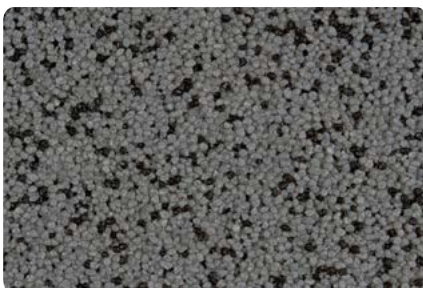
8776 (Farbton der Zwischenbeschichtung: VN2814)