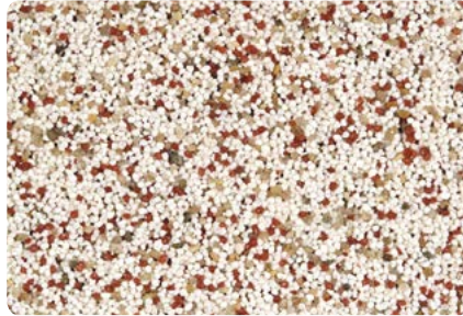
8728 (Farbton der Zwischenbeschichtung: VN2007)