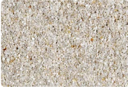
8719 (Farbton der Zwischenbeschichtung: VN2007)*