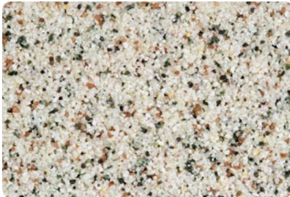
8735 (Farbton der Zwischenbeschichtung: VN2768)