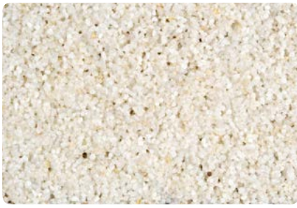
8747 (Farbton der Zwischenbeschichtung: VN2007)