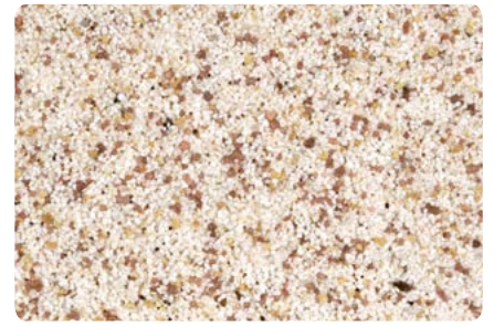
8738 (Farbton der Zwischenbeschichtung: VN2696)