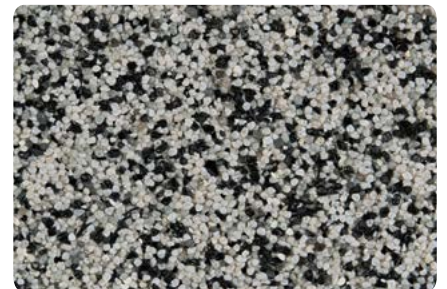
8751 (Farbton der Zwischenbeschichtung: VN2823)