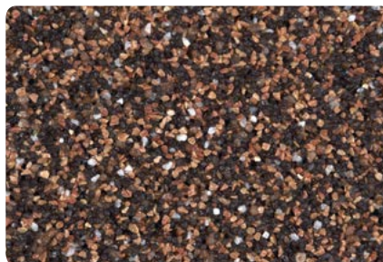
8754 (Farbton der Zwischenbeschichtung: VN2688)