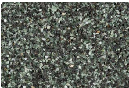
8730 (Farbton der Zwischenbeschichtung: VN2549)