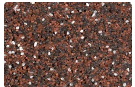
8784 (Farbton der Zwischenbeschichtung: VN2230)