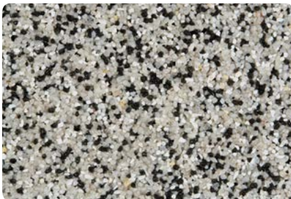
8773 (Farbton der Zwischenbeschichtung: VN2733)