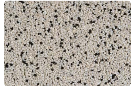
8763 (Farbton der Zwischenbeschichtung: VN2757)