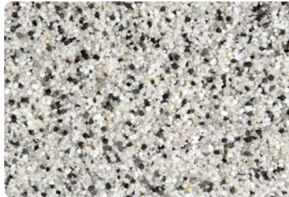
8753 (Farbton der Zwischenbeschichtung: VN2004)