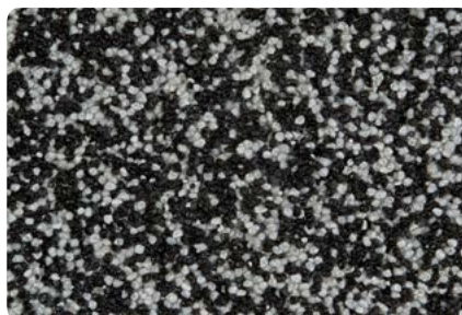
8781 (Farbton der Zwischenbeschichtung: VN2774)