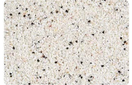
8721 (Farbton der Zwischenbeschichtung: VN2007)*