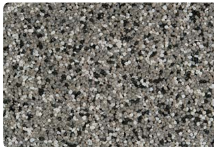
8701 (Farbton der Zwischenbeschichtung: VN2757)