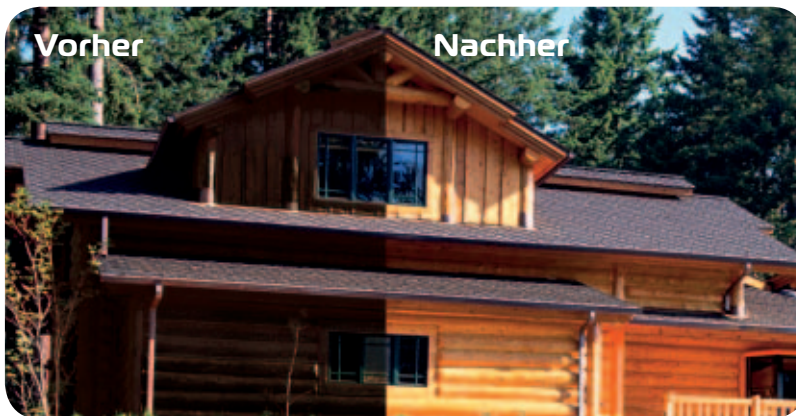
Vor und nach der Sanierung mit dem Dinolin-Renoviersystem. Mit zwei Anwendungsschritten zum Erfolg.