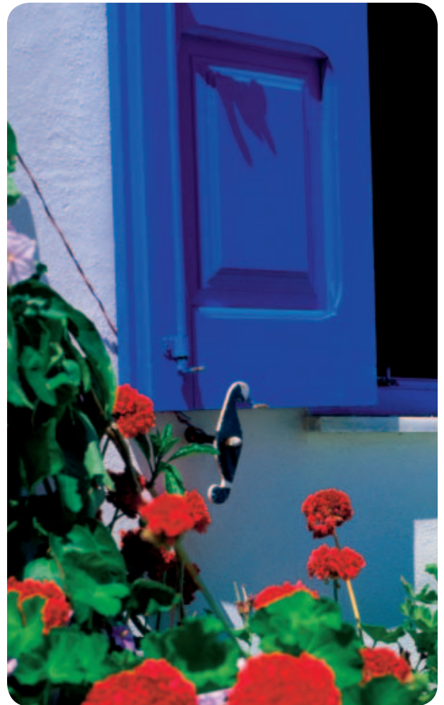
Hydro Color H-40 für die deckenden Farbtöne.