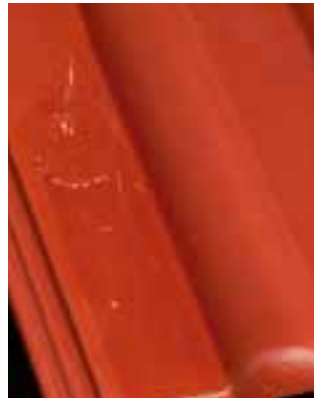
Dachziegel ohne Nano-Hybrid-Technologie

Kleinste Siliconpartikel in der Bindemittelmatrix sorgen für eine hochwasserabweisende Wirkung der Beschichtung.